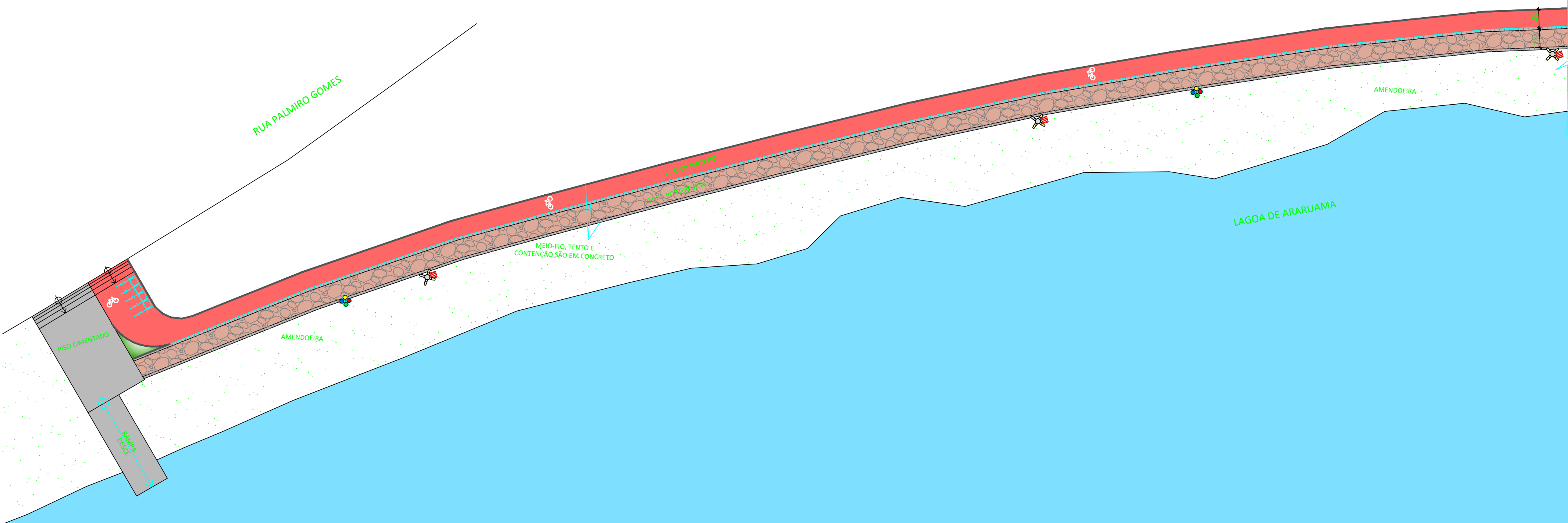
PLANTA BAIXA - TRECHO A