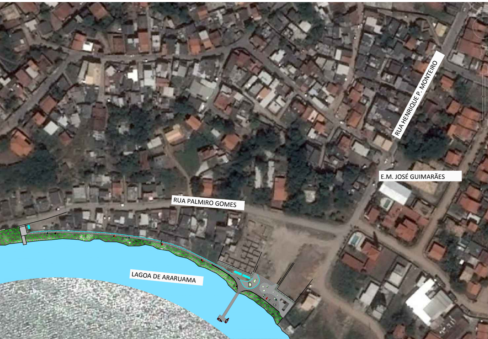
PLANTA DE SITUAÇÃO GERAL