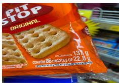
Imagem do WhatsApp de 2024-04-13 à(s) 17.23.31_10b9537b.jpg 269 KB