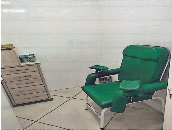
Sala de coleta 1