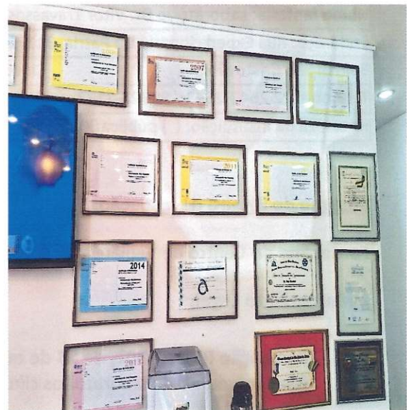
Certificados de CEQ