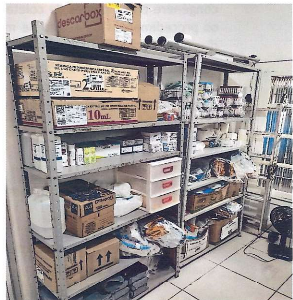
Estoque de Material