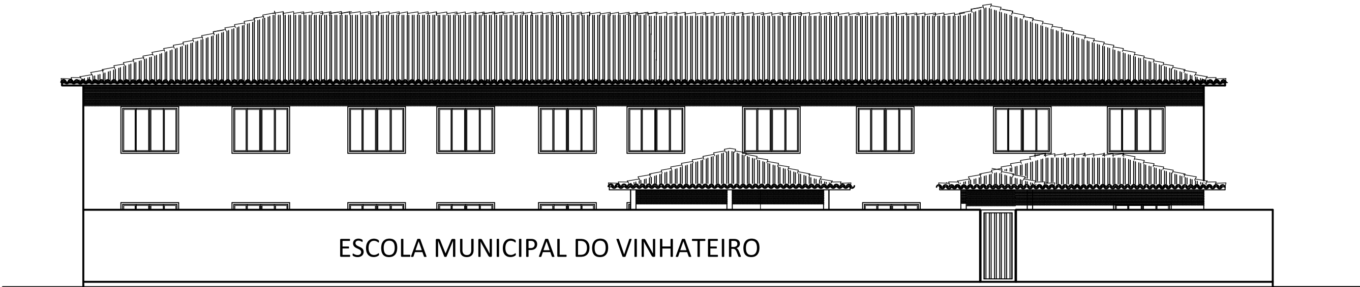
03 FACHADA ESC: 1/100